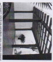
□ Imagem referencial desenvolvida para o projeto de paisagem.